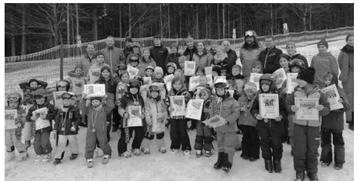
Ein Teil der Gruppe beim Abschlusstag in Mitterdorf und das Team des SC Langfurth freuen sich über den erfolgreichen Abschluss der Skierlebnistage mit Urkunde und Medaille