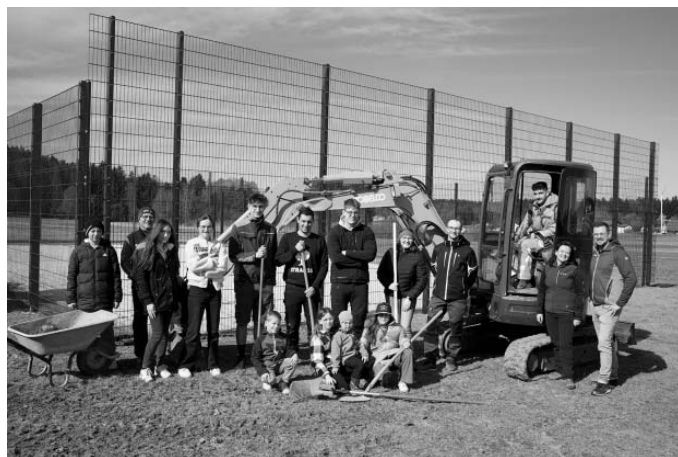
Ein Teil der Schöfweger Jugendlichen zusammen mit den Jugendbeauftragten vor dem neuen Fangzaun des Beachvolleyballplatzes.