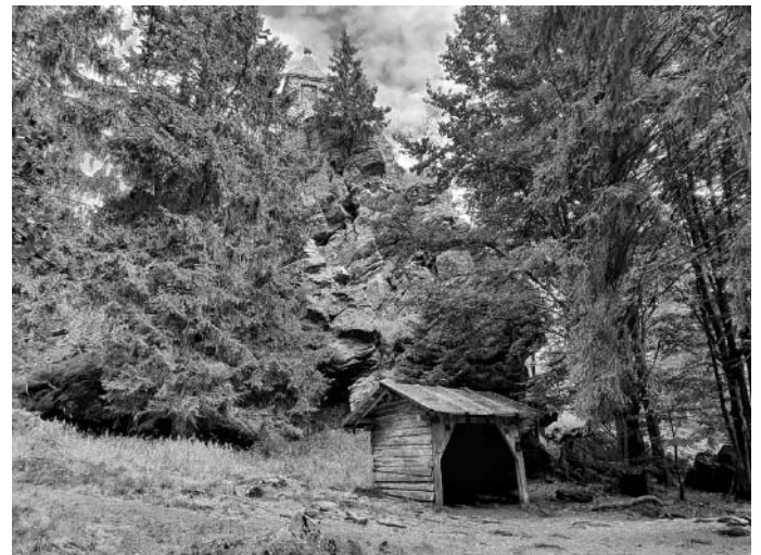
Ein weiteres Highlight der Tour ist der pittoreske Große Riedelstein.