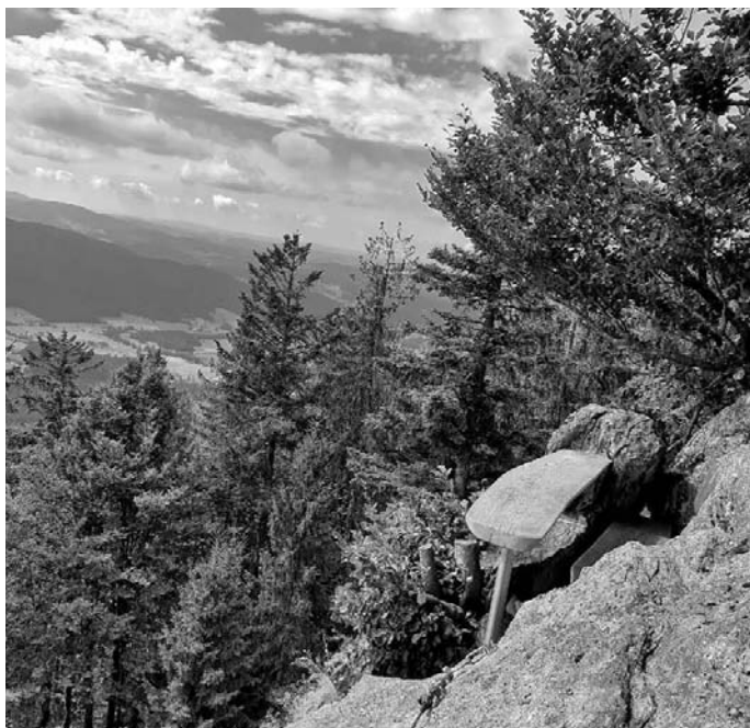
Die Bank am Kleinen Riedelstein lädt zur Rast ein.