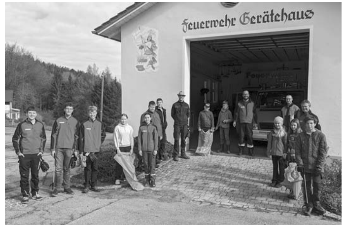
Vor der Aufräumaktion

Die Jugendfeuerwehr half wieder einmal geschlossen mit, um unsere Heimat von dem Müll zu befreien, welchen Menschen verursachen, denen unsere Umwelt scheinbar nicht so sehr am Herzen liegt. Unterstützt wurden sie zudem von einem Teil der Vorstandschaft.