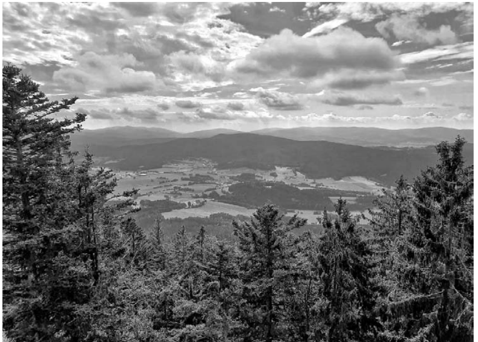
Vom Skywalk hat man eine unglaublichen Panoramablick.

Vom Kleinen Riedelstein sind es dann nur noch wenige hundert Meter bis zum Großen Riedelstein. Mit seinen 1132 Metern Höhe bildet er den höchsten Punkt des Kaitersberges, einem langge-