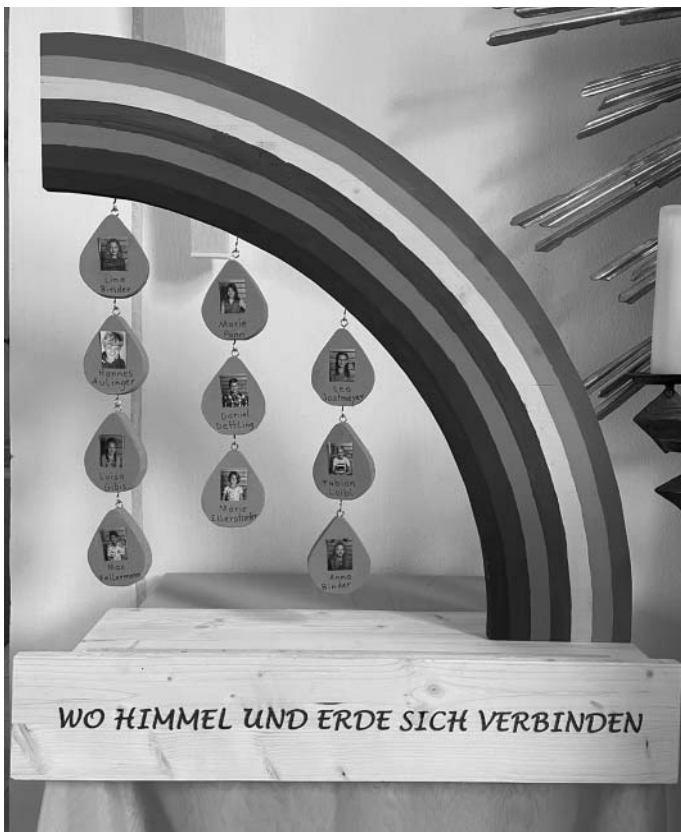
Das Motto war „Regenbogen – wo Himmel und Erde sich verbinden“ mit den Bildern der Erstkommunionkinder

Das Top-Fachgeschäft Ihres Vertrauens auf 800 m 2 !