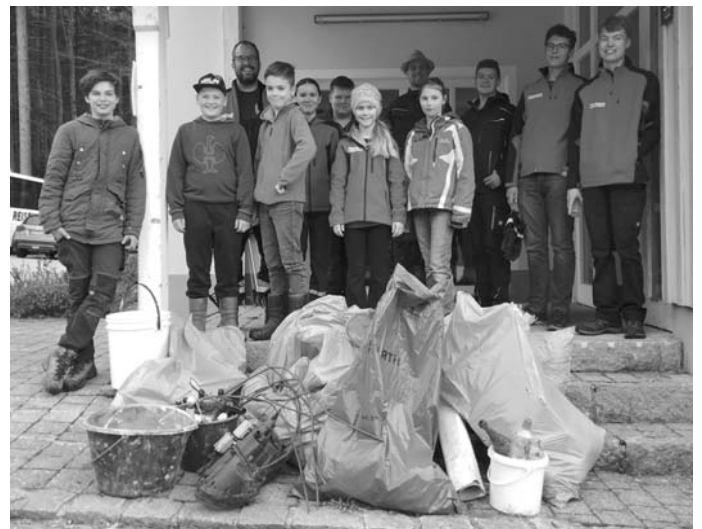
Nach der Aufräumaktion