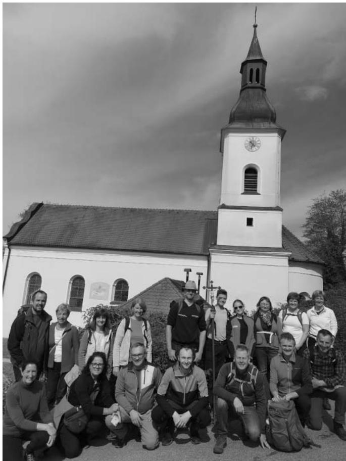
Die Pilgergruppe vor der Wallfahrtskirche Halbmeile