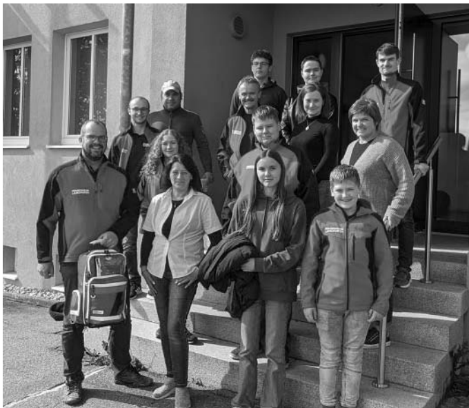
Die Teilnehmer des Erste-Hilfe-Kurses bei der Übergabe des Rettungs-rucksacks (a.r.)

Abschließend wurde der Feuerwehr Langfurth noch ein Rettungs-rucksack mit viel Erste-Hilfe Material übergeben. Dafür nochmals ein herzlicher Dank.